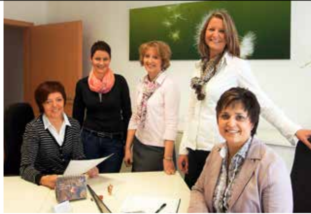
Unsere Mitarbeiter und die Pflegeleitung stehen Ihnen jederzeit kompetent in allen Fragen für Ihr Wohlbefinden zur Seite!